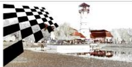
OROSHÁZI SAKK EGYESÜLET

Megemlékezés a verseny névadójáról; Megyebajnoki cím és helyezések eldöntése; Értékszám szerzés, módosítás biztosítása; A sakk játék népszerűsítése; Baráti kapcsolatok ápolása.